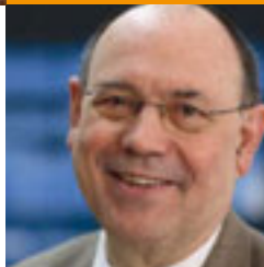
Präses Nikolaus Schneider, Vorsitzender des Rates der EKD