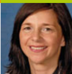
Katrin Göring-Eckardt, Präses der Synode der EKD