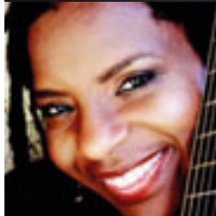
Judy Bailey, Sängerin